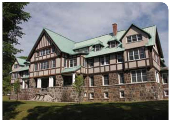
Le Pavillon Jacques-Duquette Bergeron-Gagnon inc., 2013