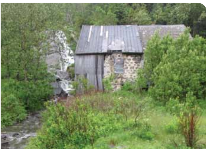
Le Moulin du Petit-Sault à L'Isle-Verte. En état de dégradation irréversible. Collection René Beaudoin, 2009.

Dans l'ensemble, ces exemples montrent bien l'influence de la participation citoyenne sur les enjeux du patrimoine. Elle est essentielle pour les biens qui ne bénéficient pas d'une protection légale même s'ils sont porteurs de valeurs