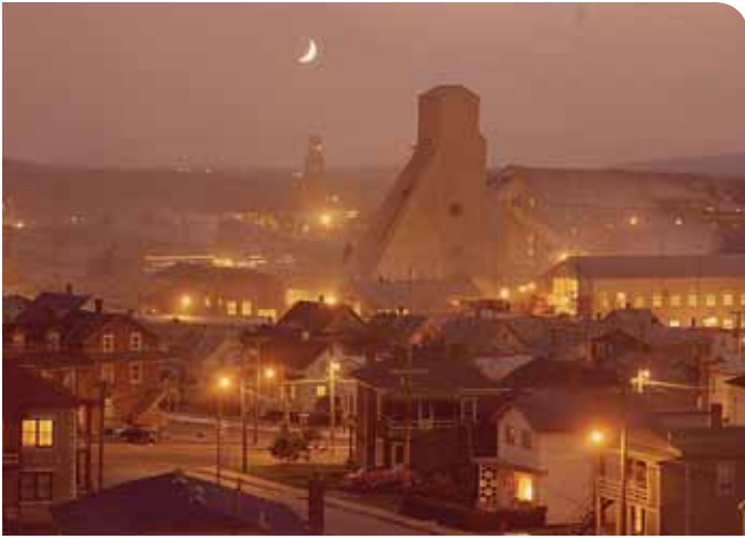
À Thetford Mines, les structures imposantes des mines d'amiante dominent la ville. Centre d'archives de la région de Thetford - Fonds Jacques Fugère, vers 1960.