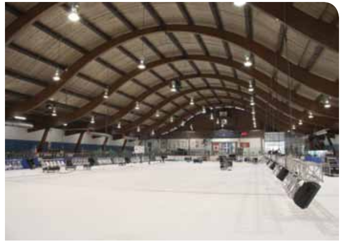
Aréna Éric-Sharp, Saint-Lambert, 1966, J.W. Cooke, architecte. Docomomo Québec (Ulisses Munarim, 2013).

patrimoniales importantes. Parmi les acteurs, les élus municipaux se retrouvent au cœur des débats où ils sont parfois initiateurs, défenseurs, gestionnaires et toujours détenteurs du pouvoir décisionnel. Pour ce qui est des outils, les pétitions et les consultations publiques révèlent que l'intérêt à défendre le patrimoine est plutôt faible au sein de la population. Elle confirme aussi l'importance des activités d'interprétation au patrimoine 11 . Ces rencontres entre les gens et leurs patrimoines favorisent une meilleure connaissance des biens. À la longue, ils l'apprécient, s'en délectent même. Ils en prennent soin et veulent le protéger. Ce travail en amont est crucial à la participation citoyenne et à la pérennité des biens patrimoniaux.