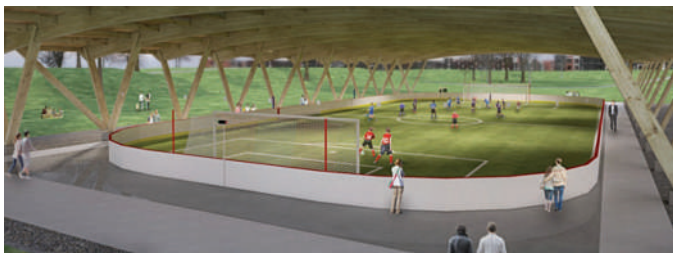
Concept Préau - Groupe BC2

Il existe néanmoins, depuis quelques années, des systèmes de glaces extérieures réfrigérées permettant d'augmenter la qualité et de prolonger l'offre d'une surface glacée (mi-novembre à mi-mars), et ce, même avec des conditions climatiques peu clémentes. Ces patinoires extérieures réfrigérées peuvent ainsi répondre à la forte demande citoyenne tout en réduisant les opérations d'entretien de la surface à long terme. Ce type d'infrastructure permet également de rationaliser le nombre de patinoires sur le territoire, sans néanmoins réduire l'offre pour les citoyens.