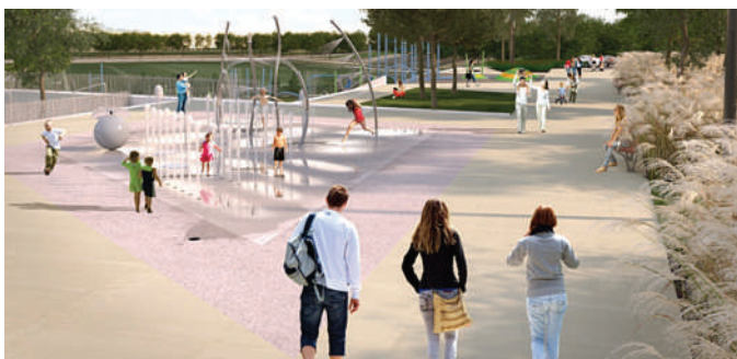
Aménagement du parc Multisports – Phase I, Ville de Saint-Jérôme – Groupe BC2

L'offre de jeux d'eau est complémentaire à celle des piscines qui demeurent nécessaires pour permettre l'apprentissage de la natation, la réalisation de compétitions de nage et l'entraînement physique en milieu aquatique, qui sont très appréciés, en particulier par la clientèle adulte et aînée.