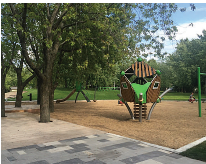
Réaménagement du parc Jason, Ville de Candiac, Groupe BC2

Cette planification débute avant tout par un inventaire et une analyse exhaustive des parcs et des équipements existant sur le territoire. Cet inventaire permet donc de dresser une liste de l'offre actuelle d'une municipalité ou d'une ville et de mesurer si celle-ci correspond réellement aux besoins de la population. Cette juxtaposition entre l'offre existante en équipements récréatifs et sportifs et les besoins de sa population permet d'identifier clairement les problématiques et les enjeux d'une municipalité en particulier. Ces constats permettront par la suite de dresser une ligne directrice vers des orientations d'aménagement répondant aux enjeux identifiés. Celles-ci mèneront vers l'élaboration d'un plan stratégique précis, étalé sur une période donnée de 5 à 10 ans selon les municipalités.