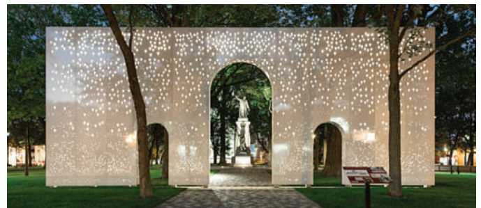
BC2 – Place du Curé-Labelle, Ville de Saint-Jérôme

Une autre tendance forte se dégage au niveau de l'éclairage extérieur qui vise la création d'ambiances. Il s'agit donc de concevoir un type d'éclairage spécifique pour créer une perception et une expérience différentes dans un espace donné. Des résultats de recherche commencent à démontrer que l'éclairage ambiant fournit non seulement un effet calmant pour l'observateur, mais augmente également la sécurité d'un site tout en réduisant le risque de vandalisme. L'éclairage ambiant est donc devenu très rapidement un standard sur la plupart des projets extérieurs, mais également l'opportunité de donner une signature lumineuse particulière dans un parc ou un espace vert.