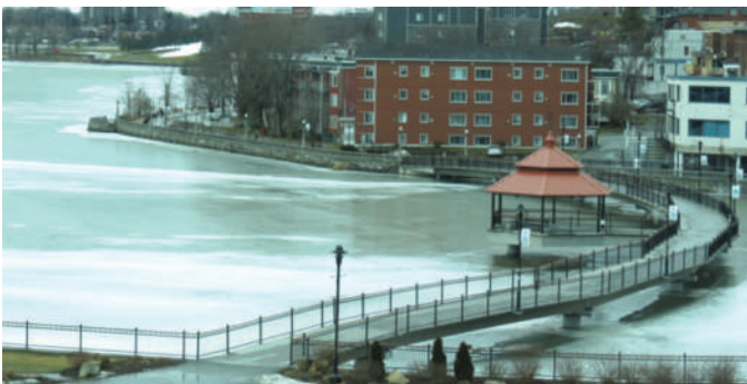
Sherbrooke : promenade du Lac-des-Nations

Pourquoi la promenade Champlain de Québec et la Promenade de la mer de Rimouski, les pistes cyclables de Montréal et celle du Lac-des-Nations de Sherbrooke sont-elles souvent engorgées ? Pourquoi, Saint-Bruno a-t-elle affiché le droit de jouer dans la rue ? Pourquoi des places éphémères et des boîtes de jeu déposées dans les ruelles ? Voilà qui modifie le visage des villes. Les pratiques de loisir ont changé. Elles sont plus spontanées et envahissent le voisinage, le quartier et le territoire municipal. Plusieurs se déroulent hors des infrastructures et aménagements habituels. Aménagements, infrastructures et réglementations constituent plus que jamais le cœur de l'offre en loisir dans la ville dorénavant axée sur la qualité de vie des citoyens, des visiteurs et adaptée à la pratique libre.