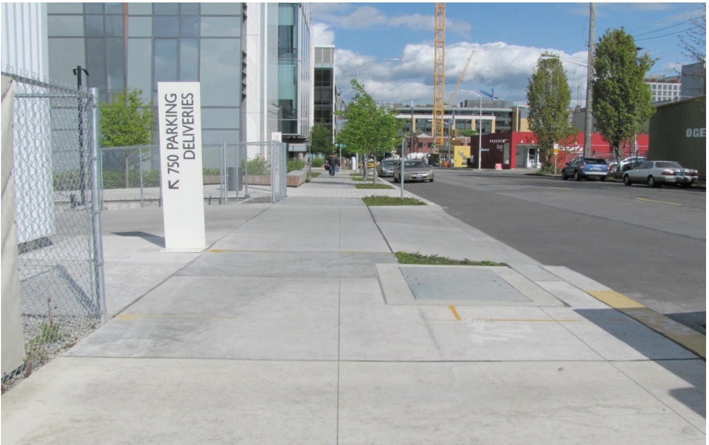
Exemple de l'utilisation de la largeur de la banquette pour la descente de véhicules

Il reste encore beaucoup à faire dans le domaine pour améliorer la situation des aînés. La réflexion doit se poursuivre.