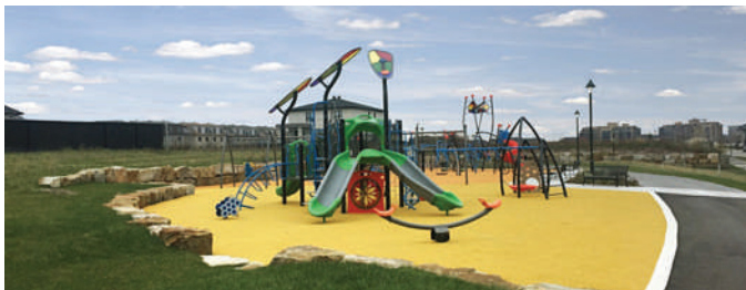
Aménagement du parc Raymond-Lagacé, arrondissement Saint-Laurent, Ville de Montréal – Groupe BC2 (sous-traitance de CDGU)

Il est recommandé de concevoir quelques parcs entièrement accessibles plutôt que de prévoir de petites interventions ponctuelles dans un plus grand nombre de parcs. En effet, le but est d'offrir un accès universel complet pour la personne à mobilité réduite, soit du stationnement jusqu'à l'accès aux différents équipements du parc, et ce, pour un enfant ou un adulte accompagnateur vivant un handicap.