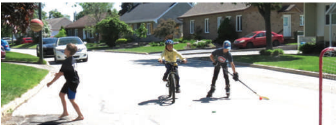
La rue, espace de jeu

Ce phénomène de diversification a fait exploser les usages et les interactions de ces usages dans les parcs et les rues des quartiers. Un parc actuel comprend autant des zones enfants, des zones adultes et aînés, des zones de flânerie, des surfaces sportives structurées et réglementées que des surfaces de jeu libre (pour jouer au ballon ou faire voler son drone, par exemple). S'y tiennent des événements de toutes sortes, de la fête des voisins à l'anniversaire d'une grand-mère en passant par un rassemblement de « djembés ». Bref, le parc est une place publique dédiée autant aux individus et aux groupes en pratique libre qu'aux équipes et clubs sportifs, il n'y a pas que le parc qui soit révisé. Au cours des paragraphes qui précèdent, a souvent été évoquée la pratique de l'activité physique devenue, à la faveur des multiples campagnes de sensibilisation, une habitude pour un nombre croissant de personnes. Faire son jogging, jouer dans la rue, prendre une marche, marcher pour atteindre des commerces de proximité interpellent de plus en plus la conception des milieux de proximité, qu'elle corresponde au lieu de résidence, au lieu de travail et d'étude ou à quelque troisième lieu. Indice piétonnier, accès à un espace vert en moins de 10 minutes à pied, permis de jouer dans la rue et aménagement de sécurité afférents, animation de ruelles, places éphémères, voilà quelques exemples où les professionnels du loisir et ceux de l'urbanisme se rencontrent.