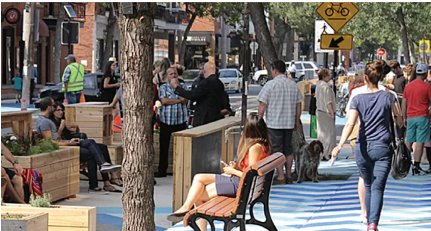
Place de Castelnau