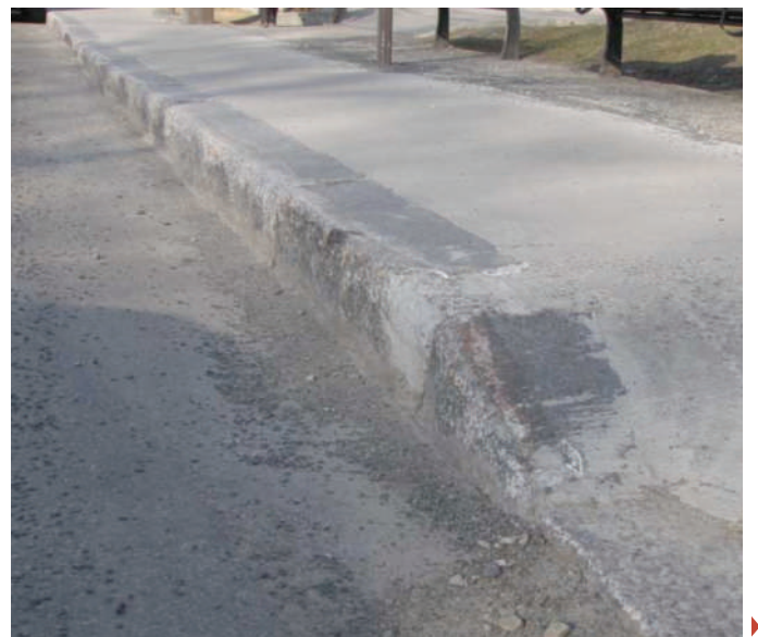
Un côté d'une entrée charretière construite en 2014 avec une pente maximale de 45 %

Beaucoup d'efforts ont été déployés afin d'adapter les trottoirs aux besoins des personnes à mobilité réduite communément appelés les « classiques » : les personnes avec des incapacités visuelles et les personnes en fauteuil roulant. Depuis une trentaine d'années, les « bateaux pavés » ou abaissements de trottoirs se sont multipliés pour faciliter le passage des fauteuils roulants (et, on doit l'avouer, le passage des chenillettes de déneigement, ce qui a suscité l'adhésion des Services de travaux publics !). Pour permettre aux personnes malvoyantes de savoir reconnaître la fin du trottoir et le début de la chaussée, une bordure résiduelle a été « normalisée » à 13 mm (un demi-pouce).