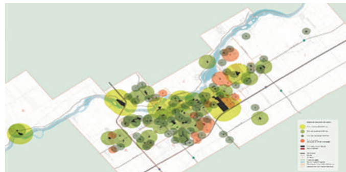
Carte des dessertes des parcs de quartier, de voisinage et des parcs municipaux de la Ville de Drummondville, PDPEV de Drummondville, 2017 – Groupe BC2

des contraintes budgétaires locales. Élaboré en étroite collaboration avec les intervenants municipaux, le plan directeur s'assure de répondre aux besoins de l'ensemble de la communauté de la municipalité ou de la ville identifiée, d'être effectué en considérant l'évolution démographique de la population et les changements climatiques. Il implante également les nouvelles tendances en matière d'aménagement de parcs et d'espaces verts.