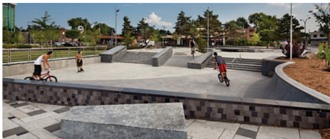
Aménagement du skate-plaza / skatepark sur la place Saint-Sacrement, Ville de Terrebonne – Groupe BC2

D'abord considéré comme une tendance éphémère, la pratique de la planche à roulettes est en pleine croissance et sa popularité ne cesse d'augmenter, notamment pour les groupes d'âge de 12 à 19 ans. En effet, l'Institut national de santé publique du Québec recensait qu'en 2004, 348 000 personnes avaient affirmé avoir pratiqué ce sport comparativement à 432 000 personnes pour le baseball au cours de la même année. Cette statistique permet donc de certifier que la planche à roulettes est maintenant une pratique confirmée et répandue.