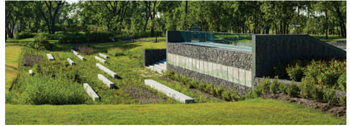
Aménagement du parvis sud du parc Frédéric-Bach au Complexe environnemental Saint-Michel – Ville de Montréal – Groupe BC2

L'apport végétal sur un site est un atout majeur offrant plusieurs bénéfices environnementaux. Outre la création d'une ambiance distinctive par l'implantation d'arbres et de plantations contrastantes, un traitement végétal optimise les espaces verts en maximisant la biomasse et en limitant l'effet des îlots de chaleur lié à la création de grandes surfaces minéralisées. Ainsi, une bonne planification du traitement végétal devrait s'orienter vers une conservation et une préservation de la végétation existante sur un site donné et sur l'intégration d'arbres à grand déploiement pour favoriser la création d'îlots de fraîcheur.